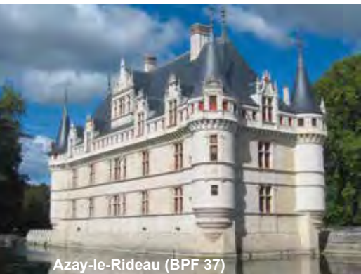
Azay-le-Rideau (BPF 37)