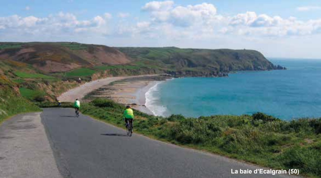
La baie d'Ecalgrain (50)